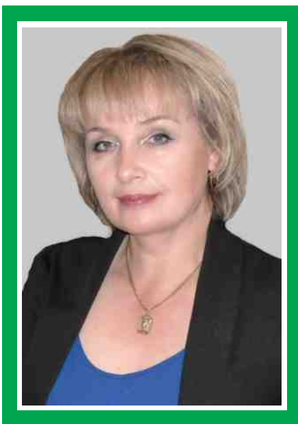
Председатель Совета по сестринскому делу, главная медицинская сестра