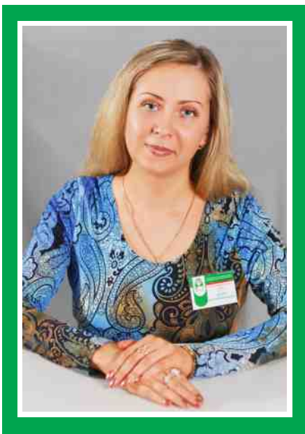
Председатель Совета по сестринскому делу, главная медицинская сестра

Количество членов ОПСА на 01.10.2016 г.: 44 человека (66%)