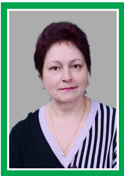
Председатель Совета по сестринскому делу, главная медицинская сестра