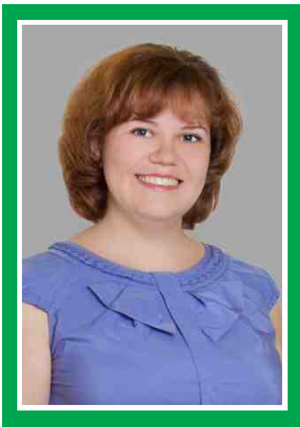
Председатель Совета по сестринскому делу, главная медицинская сестра

Адрес места нахождения медицинской организации: 644010, г. Омск, ул. Сергея Лазо, 2 Сайт медицинской организации: www.инфекционная-больница.мед55.рф Электронный адрес председателя Совета: ikb1.gl.ms@mail.ru Телефоны председателя Совета: моб. 8-951-420-59-03 Дата создания Совета: 04.01.1979 г. Количество сестринского персонала на 01.10.2016 г: 78 человек Количество членов ОПСА на 01.10.2016 г: 52 человека (67%)