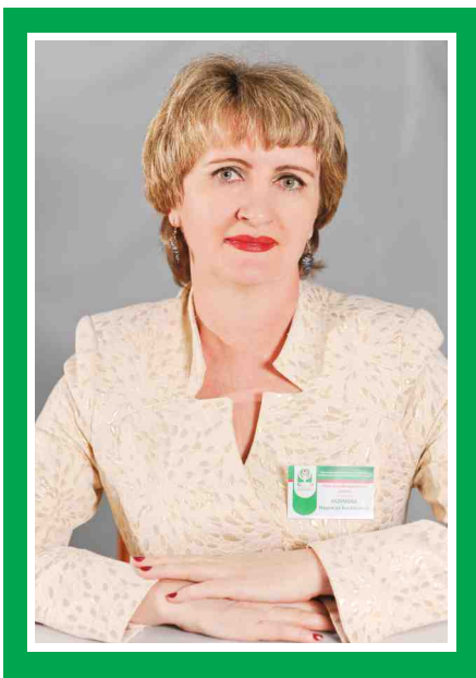
Председатель Совета по сестринскому делу, главная медицинская сестра

Количество членов ОПСА на 01.10.2016 г: 67 человек (74%)