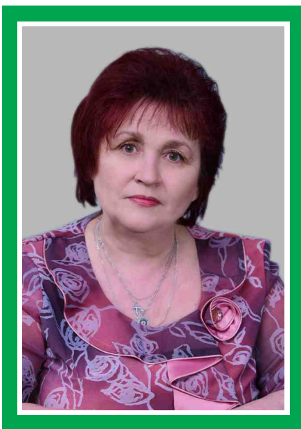
Председатель Совета по сестринскому делу, главная медицинская сестра

Адрес места нахождения медицинской организации: 646600, Омская область, р.п. Горьковское, ул. Ленина, 32 Сайт медицинской организации: www.gorkovcrb.ru Электронный адрес председателя Совета: gal.1956@yandex.ru Телефоны председателя Совета: раб. (38157) 2-19-47 моб. 8-908-117-72-67 Дата создания Совета: 17.05.1982 г. Количество сестринского персонала на 01.10.2016 г.: 133 человека Количество членов ОПСА на 01.10.2016 г.: 126 человек (95%)