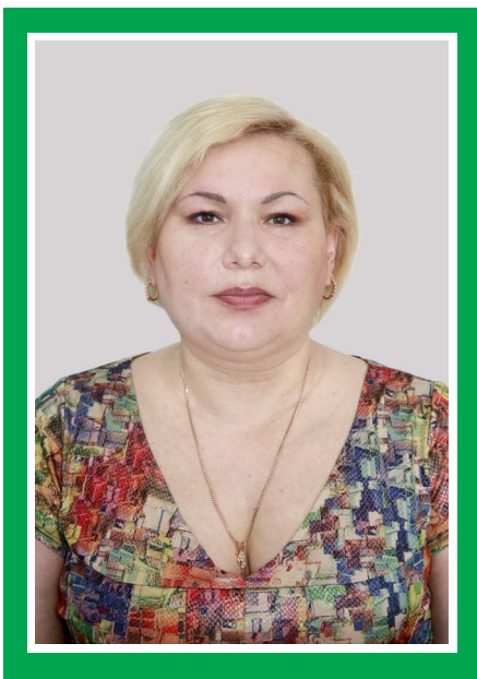
Председатель Совета по сестринскому делу, главная медицинская сестра